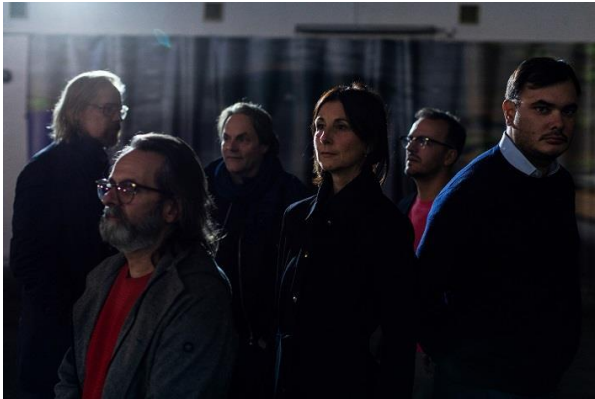
La Stampa