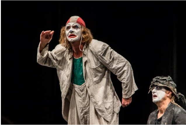
Wenzel & Mensching

In den 80er Jahren versetzte das Clownduo Wenzel & Mensching mit ihren Stücken NEUES und LETZTES AUS DER DaDaeR die Kulturszene der DDR in Aufregung. Sie wirbelten Ansichten und Unerträglichkeiten mit den Zauberticks von Kindern durcheinander und verstanden es, Theater, Musik, Kabarett und Poesie auf ungewöhnliche Weise zu verweben. Im Jahre 2000 verabschiedeten sie sich mit einer großen Tournee von ihrem Publikum. 2016 kehrten sie nach einer 16-jährigen Pause mit einer neuen Inszenierung zurück. Ein anarchistisches Feuerwerk zur Erhellung der Absurditäten dieser NEUEN SCHÖNEN WELT. Mehr Informationen