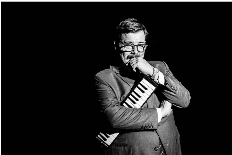
Carsten 'Erobique' Meyer

Carsten 'Erobique' Meyer spielt live die schönsten Musiken aus der beliebten TV-Serie Der Tatortreiniger . Seit 2011 komponierte Carsten Meyer für jede der 27 Folgen einen eigenen Soundtrack. Live wird er mit einigen Kollaborateuren und Freunden eine Auswahl an Songs und Stimmungen auf die Bühne bringen.