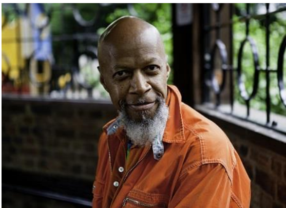
Laraaji

Laraaji ist Musiker, Mystiker und Meditationspraktiker aus New York City. In den 70er Jahren begann er auf der Straße zu musizieren. Er improvisierte Trance-erzeugende Jams auf einer modifizierten Autoharp, die durch verschiedene elektronische Effekte bearbeitet wurde. Brian Eno sah ihn