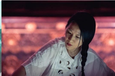
Tomoko Sauvage

Andrew Pekler, 1973 in Usbekistan geboren, wuchs bis 1995 in den Vereinigten Staaten auf und lebt seitdem in Deutschland. Als Künstler arbeitet Pekler mit Techniken des digitalen Sampling und analogen Synthesizern, um Found Sounds und archiviertes Musikmaterial neu zu arrangieren.