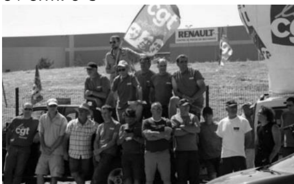
Arbeitskampf in La Souterraine

Vergessene Arbeitskämpfe – Ein Punk Abend Donnerstag, 14.02.2019, 22 Uhr Volksbühne Roter Salon 8 / erm. 5 €