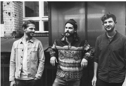
Mighty Oaks

Eine Berliner Geschichte: Drei junge Menschen aus Washington, Südwestengland und Italien treffen sich in Berlin und gründen eine Folk-Band. Sehr schnell füllen sie große Hallen. Mit einem speziellen Akustik-Programm wollen sie nun noch einmal die Wurzeln ihrer Musik erkunden.