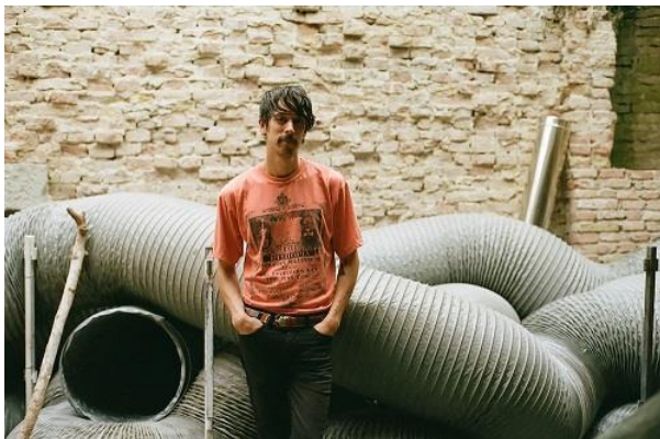
Sun Araw

Sun Araw Samstag, 23.02.2019, 21 Uhr Volksbühne Roter Salon 12 €