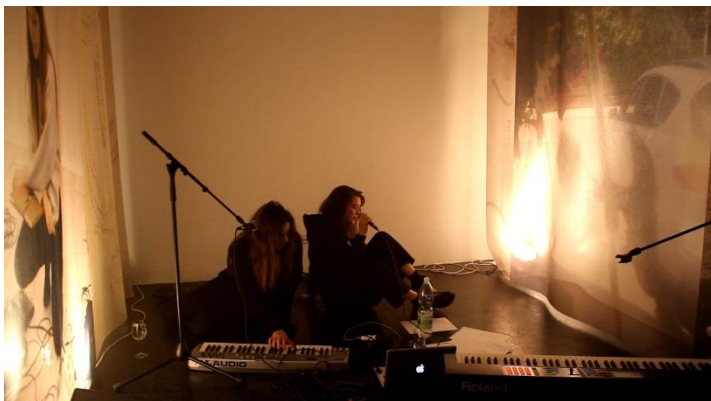
Lonely Boys

Lonely Boys, Flora Yin-Wong, Philip FM Samstag, 17. November, 21 Uhr Volksbühne Roter Salon 12 €