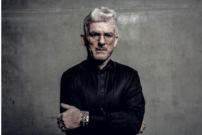
Heinz Strunk

Heinz Strunk Das Teemännchen Freitag, 16. November, 20 Uhr Volksbühne Großes Haus 20 / 16 €