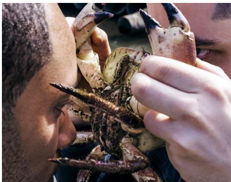
Primitive Art

Das italienische Duo Primitive Art, das Anfang des Jahres seine EP Crab Suite auf Warps Sub-Label Arcola veröffentlicht hat, wird live auftreten, gefolgt von Wilted Woman (Alien Jams und She Rocks!).