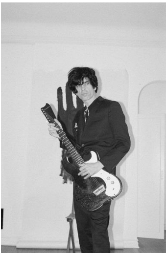
Ian Svenonius

Make-Up und Chain & the Gang Frontman Ian Svenonius mit seinem Soloprojekt. Parallel zum Konzert ist auch eine Ausstellung mit Werken von ihm im Pavillon zu sehen. Mehr Infos