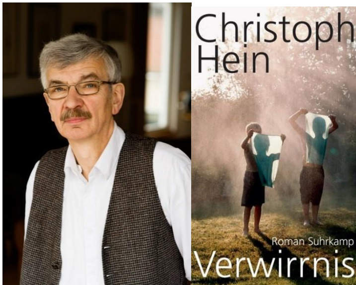
Christoph Hein

Friedeward liebt Wolfgang. Und Wolfgang liebt Friedeward. Sie sind jung, genießen die Sommerferien, fahren mit dem Fahrrad die weite Strecke ans Meer, und reden stundenlang über Gott und die Welt. Sie sind glücklich, wenn sie zusammen sind, und das scheint ihnen alles zu sein, was sie brauchen. Doch keiner darf wissen, dass sie mehr sind als beste Freunde. Es sind die 1950er-Jahre, sie leben im katholischen Heiligenstadt, und für die Menschen um sie herum, besonders für Friedewards strenggläubigen Vater, ist ihre Liebe eine Sünde. Käme ihre Beziehung ans Licht, könnten sie alles verlieren. Als sie zum Studium nach Leipzig gehen – Friedeward studiert Germanistik, Wolfgang Musik –, finden sie dort eine Welt gefeierter Intellektueller, alles flirrt geradezu vor lebendigem Geist. Und so lernen sie